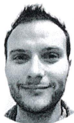
Gérard Felin Production technique